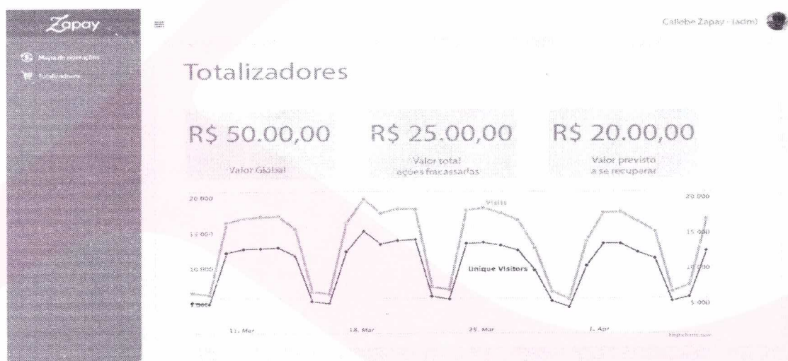
Legenda: Foto do portal administrativo com totalizadores de 'valor total recuperado', 'valor global', 'valor total de ações fracassada a princípio', 'valor previsto a se recupera'.